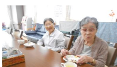
⑦美味しくいただきます