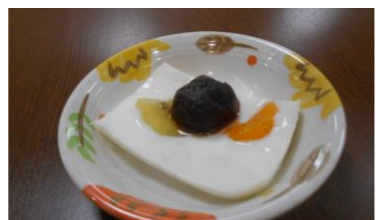
⑥冷蔵庫で冷やして出来上がり