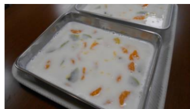
④バットに牛乳寒天とフルーツを入れる