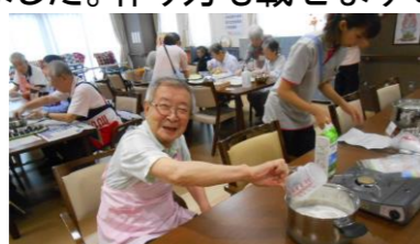
③牛乳、寒天、砂糖を温める