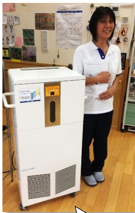
三協エアテック株式会社 業務用加湿器 うるおリッチ